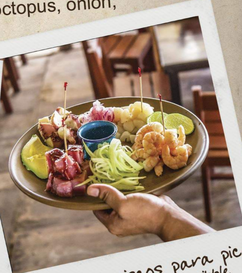
Plato de mariscos para picar Seafood platter to nibble