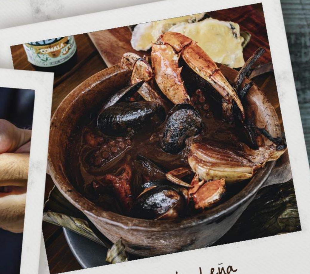
Cazuela a la Leña Firewood seafood soup