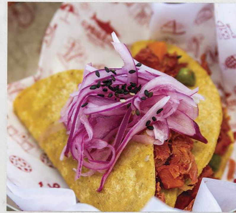
Tacos dorados de atún ahumado fried tacos stuffed with smoked tuna

Taco negro de pescado Tikin Xic al horno (2 pzas) Black tacos, prepared on the wood-fire oven with Japanese mayonnaise, squid ink, cabbage and onion