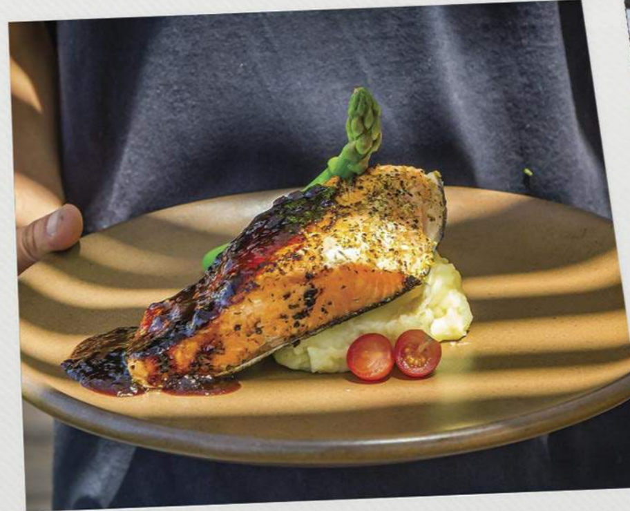
Salmón Jack's Jack Daniels salmon

*Pregunte por nuestro postre del día *Ask for the dessert of the day