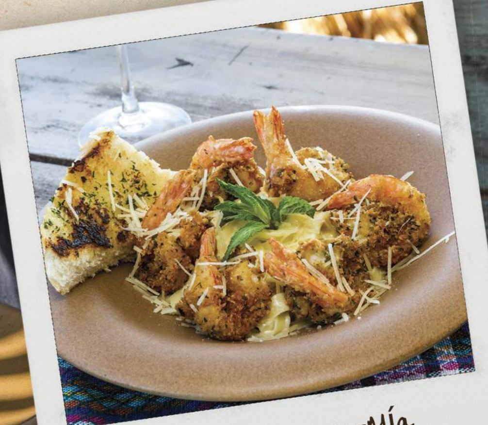
Camarones Roma-Mía Roma-Mia shimps