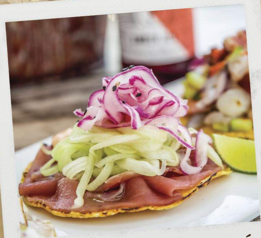
Tostada de carpaccio de atún Yellow tail tuna carpaccio tostada