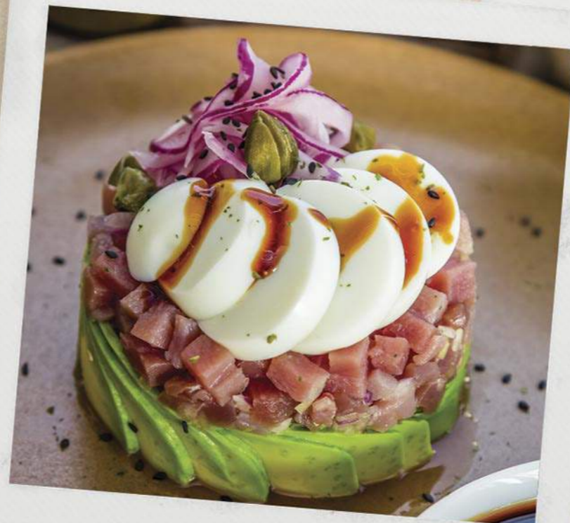
Tártara de atún Tuna tartara steak