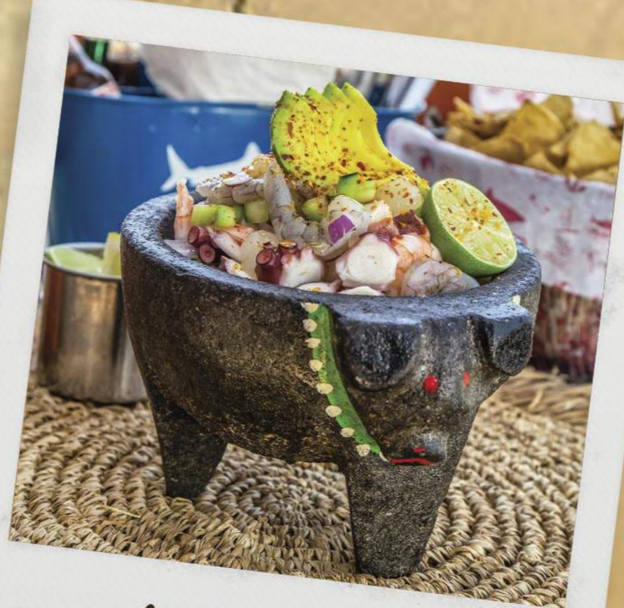
Ceviche Maza maza ceviche