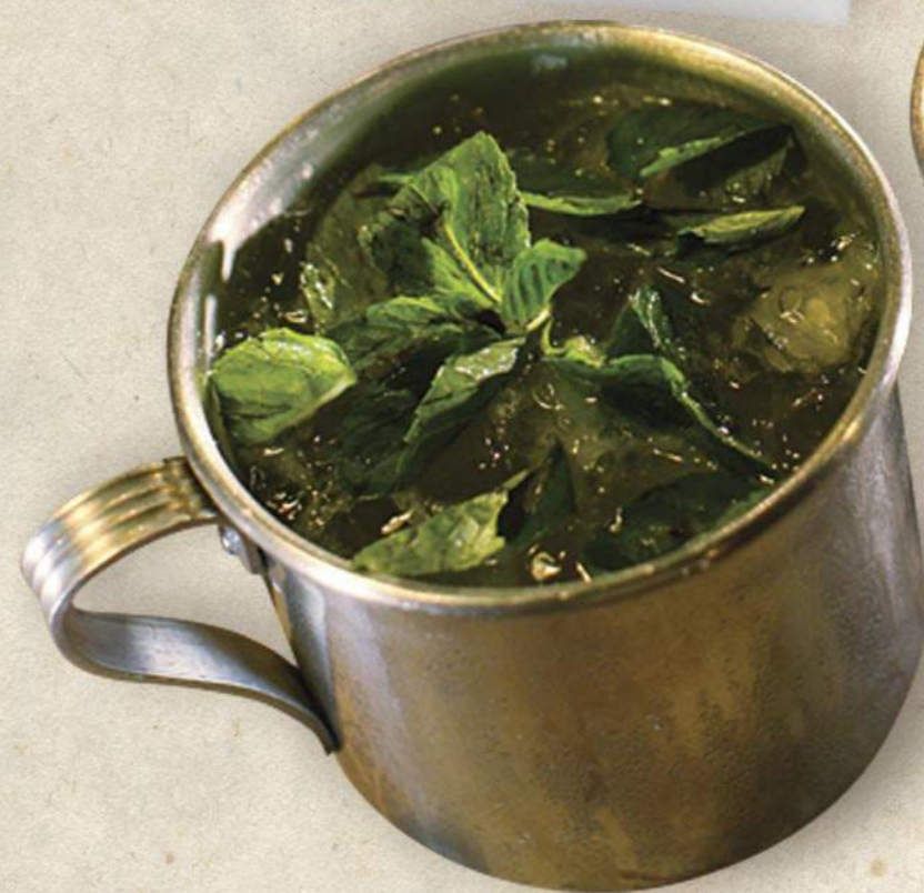
Margaritas & Mojitos